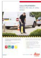
Leica UTILIFINDER+ Flyer

Abbildungen, Beschreibungen und technische Daten sind unverbindlich. Änderungen vorbehalten. Gedruckt in der Schweiz – Copyright Leica Geosystems AG, Heerbrugg, Schweiz, 2015. 844398de – 01.16