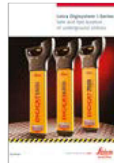
Leica Digicat i-Serie Broschüre