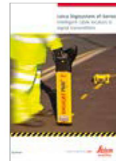
Leica Digicat xf-Serie Broschüre