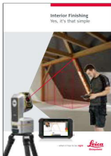
Leica iCON trades für den Innenausbau Broschüre

Hexagon (Nasdaq Stockholm: HEXA B) beschäftigt ca. 24.000 Mitarbeiter in 50 Ländern und verzeichnet einen Umsatz von rund 5,2 Milliarden Euro. Erfahren Sie mehr auf hexagon.com und folgen Sie uns unter @HexagonAB