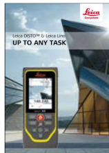
Leica DISTO™ und Lino Produktfamilie Broschüre